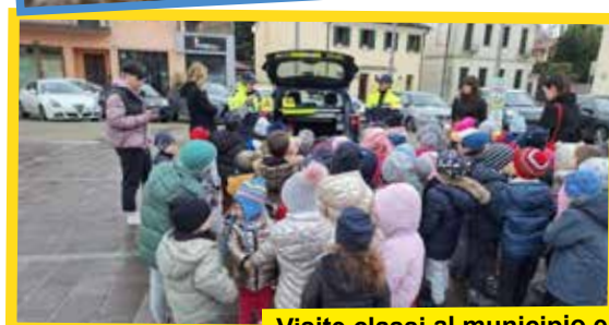
Visite classi al municipio e alla Polizia Locale