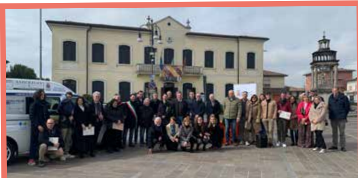
Nuovo pulmino attrezzato