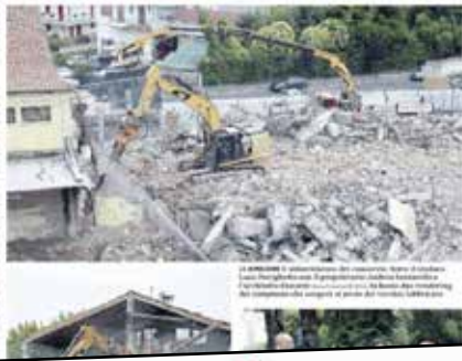
La demolizione di un edificio abbandonato da anni. Al suo posto sarà costruito un complesso da 50 mila metri cubi. Il sindaco Durigetto ha dichiarato: «È un giorno storico per Zero Branco. Al suo posto sarà costruito un complesso da 50 mila metri cubi. C'è nostalgia per quello che ha significato, ma era una bruttura».

La demolizione è stata effettuata dalla ditta "Lavorando" e ha permesso di liberare un'area di circa 50 mila metri cubi. Il sindaco Durigetto ha dichiarato: «È un giorno storico per Zero Branco. Al suo posto sarà costruito un complesso da 50 mila metri cubi. C'è nostalgia per quello che ha significato, ma era una bruttura».