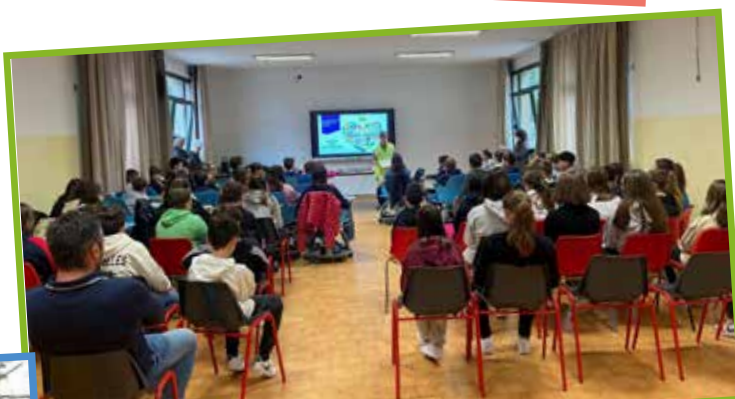
Alimentazione sana e corretti stili di vita Una lezione speciale per le seconde medie