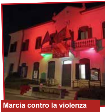
Marcia contro la violenza