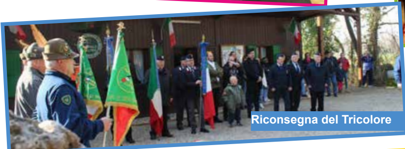
Riconsegna del Tricolore